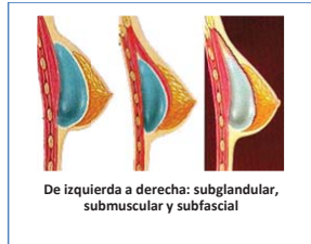
Imagen tomada de: La Revista de Cirugía Estética . Submuscular, subfascial o subglandular ¿Cuál es la mejor?

variar, entre otras cosas, la apariencia, el riesgo de ruptura, el resultado de las mamografías, y el dolor del posoperatorio. Sea cual sea la colocación, al ser el implante un cuerpo extraño, el organismo genera un tejido cicatricial alrededor del mismo, que permite que el implante permanezca en su lugar.